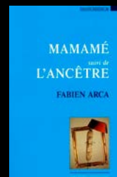
MAMAMÉ suivi de L'ANCÊTRE